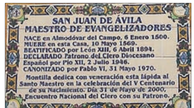
Inscripción en cerámica en la casa del santo sacerdote español

bir un día la sagrada ordenación. Invito a todos a que vuelvan la mirada hacia él, y encomiendo a su intercesión a los obispos de España y de todo el mundo, así como a los presbíteros y seminaristas, para que perseverando en la misma fe de la que él fue maestro, modelen su corazón según los sentimientos de Jesucristo, el Buen Pastor, a quien sea la gloria y el honor por los siglos de los siglos. Amén.